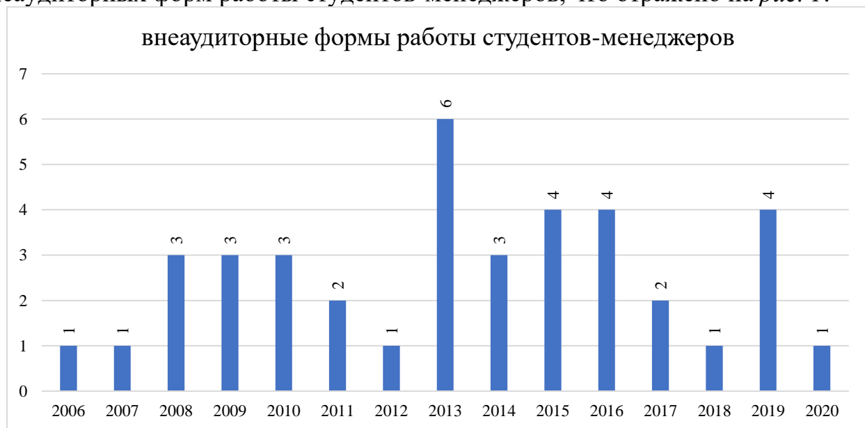
Рис. 1. Динамика количества научных исследований, индексируемых в базах ВАК и РИНЦ по представленной теме

Результаты проведенного контент-анализа научных публикаций показывают относительно низкий исследовательский интерес к теме применения внеаудиторных форм работы студентов-менеджеров, что отражено на рис. 1 .