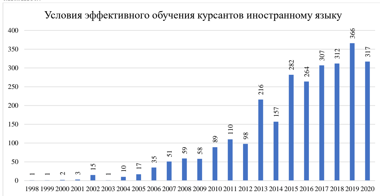
Рис. 1. Контент анализ исследований по ключевому слову «Условия эффективного обучения курсантов иностранному языку» согласно данным поисковой системы elibrary.ru

На рис. 1 представлены данные, полученные в ходе проведения контент-анализа: