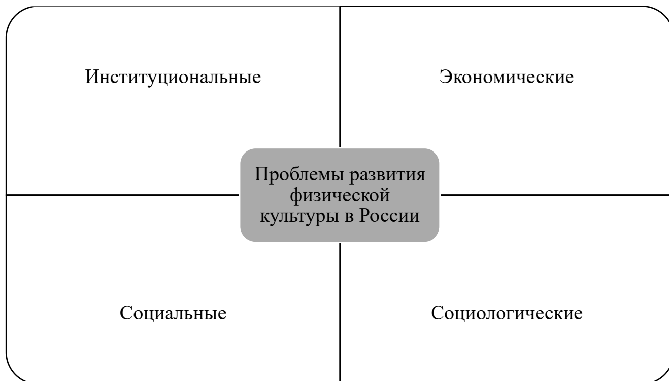
Рис. 2. Комплекс проблем развития физической культуры в Российской Федерации [1; 2; 3; 6; 7; 8 и др.]

Нами были определены следующие классификационные основания для рассмотрения проблем развития физической культуры в России: