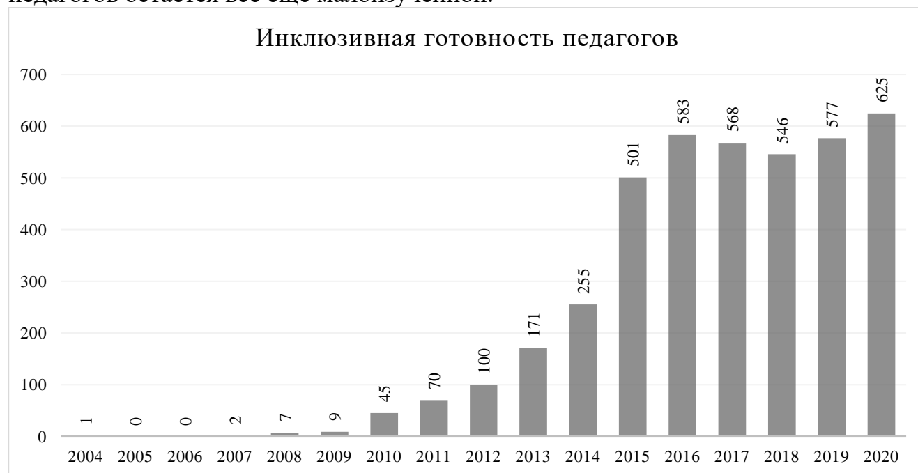
Рис. 1. Количество исследований с упоминанием ключевого слова «инклюзивная готовность педагогов», индексируемых в ВАК и РИНЦ через поисковую систему eLibrary.ru

Кроме того, в процессе проведения контент-анализа, результаты которого представлены на рис. 1 , было установлено, что тема инклюзивной готовности педагогов остается все еще малоизученной.