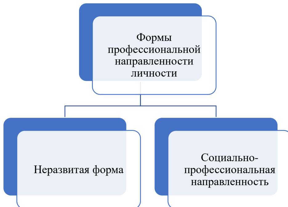
Рис. 2. Формы профессиональной направленности личности [9; 13]

Неразвитая форма профессиональной направленности личности представляется как совокупный результат овладения программой подготовки, формирования знаний, умений, навыков и компетенций без их переноса и принятия на личностном уровне. В таком случае отсутствует элемент воспитательного процесса. Социально-профессиональная направленность, напротив, имеет все необходимые узконаправленные воспитательные элементы воспитания личности (на уровне качеств) в их сочетаемости с широкими социальными качествами [9; 13].